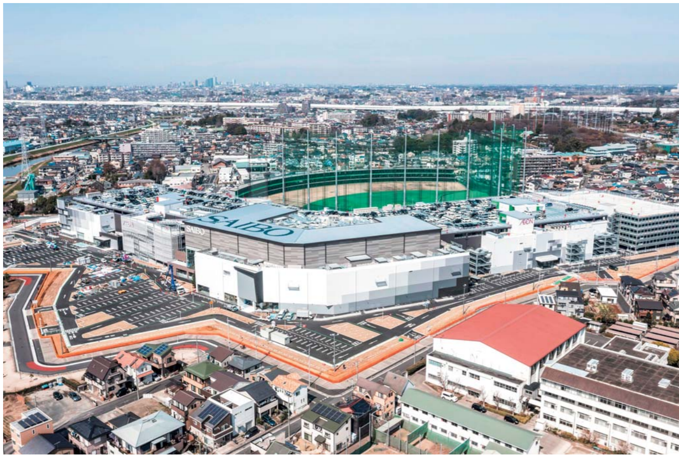
上空から見た全景