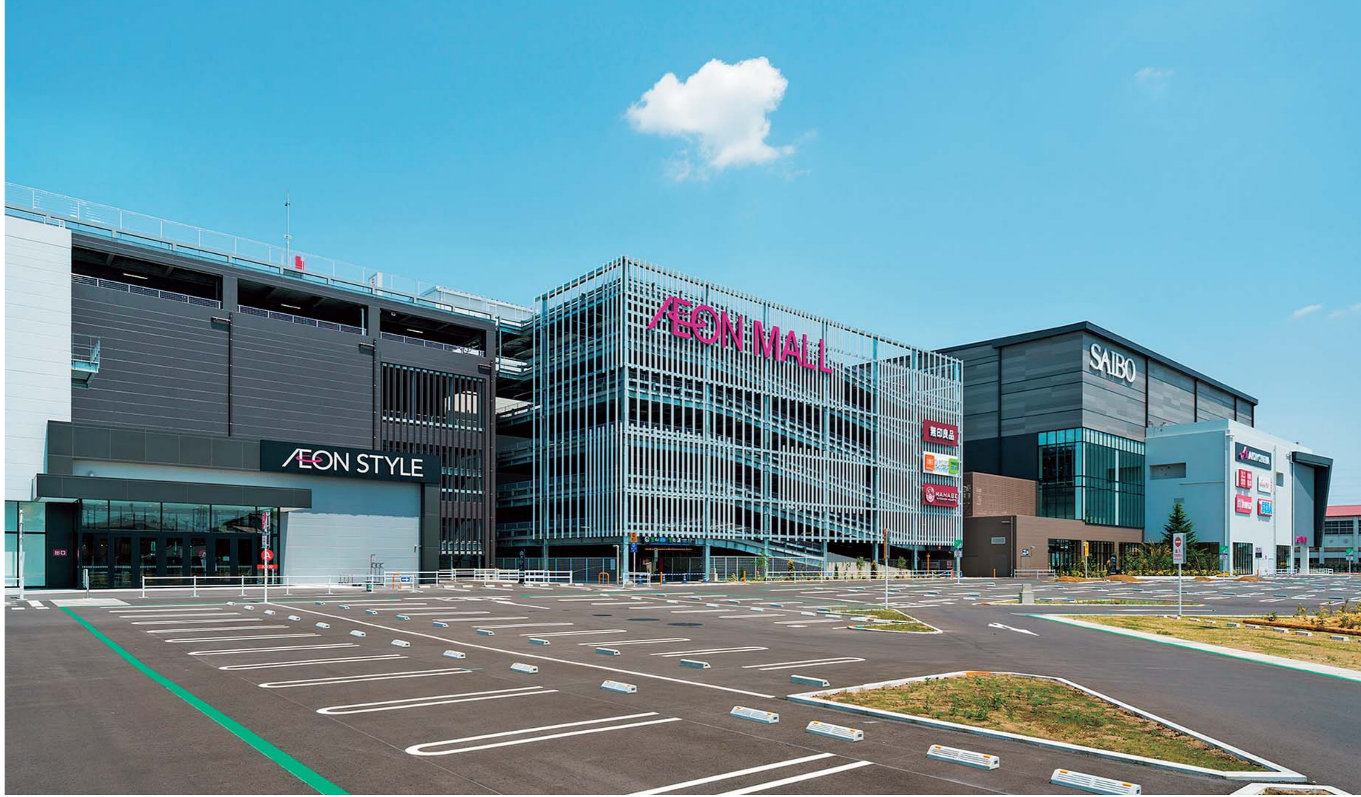
北東側全景