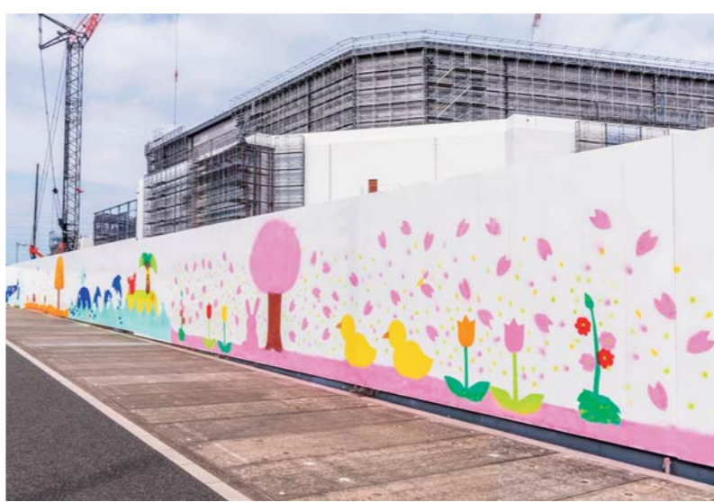
仮囲い壁紙アート

感染防止対策とはいえ、対面無しの安全管理、指導や、お客様と細かいニュアンスを伝えるのは難しいと感じました。一方で、今まで無駄な会議が多かったとも感じています。今後の現場運営は、3D、4Dを活用して、お客様へ分かり易く説明することに努め、熟練工が少なくなり、経験不足な作業員へも簡潔明瞭な説明が求められるでしょう。それでも、優秀な道具があっても使う技術者が力量不足であれば宝の持ち腐れです。私たちの世代が、率先してシステムを構築し次世代へ引き継ぐ必要性を感じています。