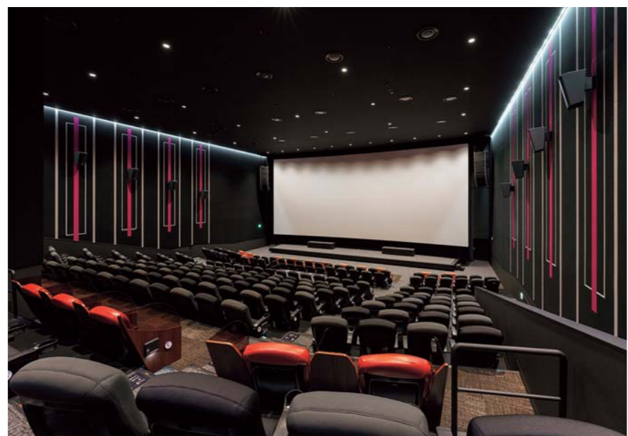
イオンシネマ