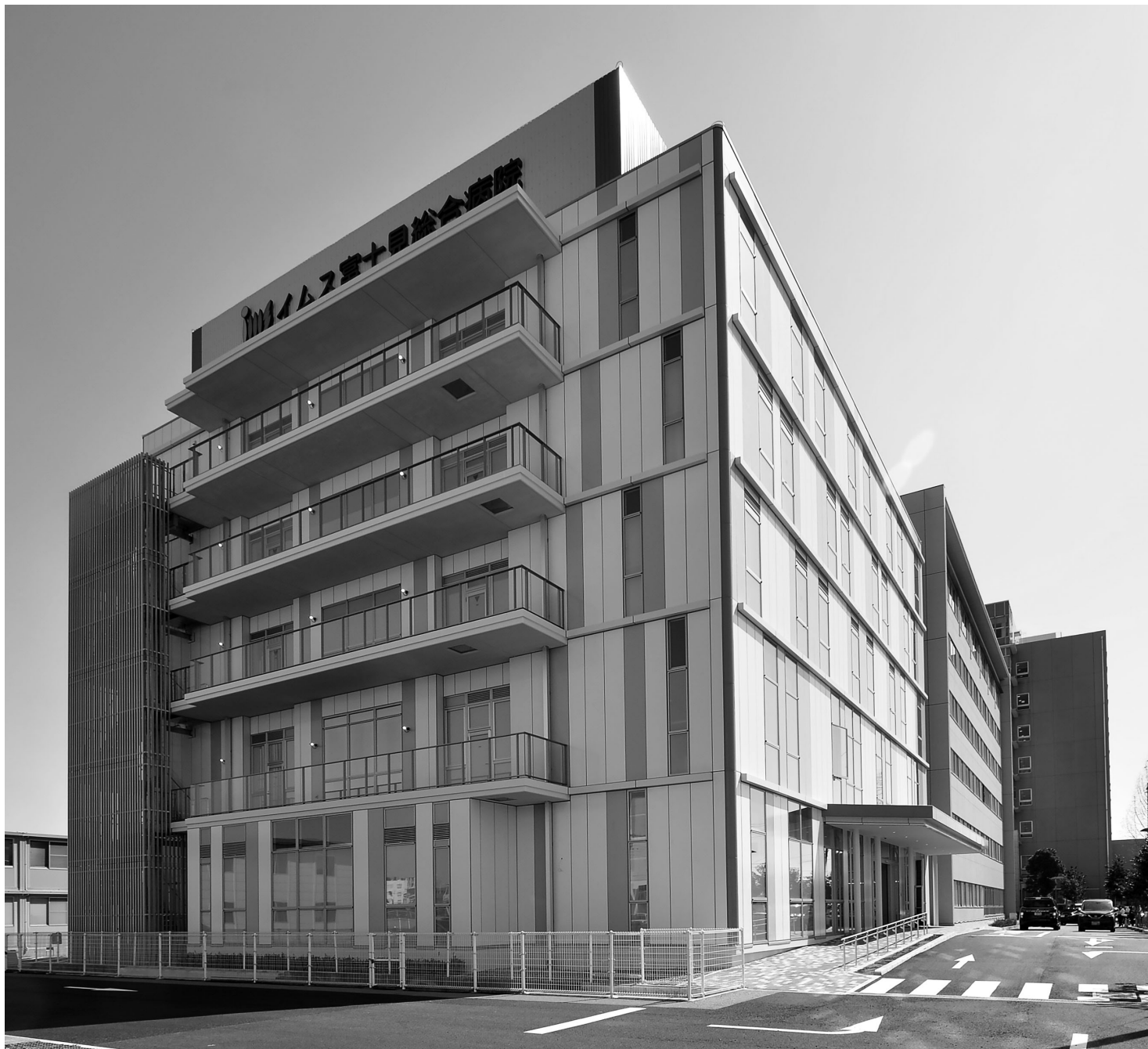
宝石箱をイメージした外観