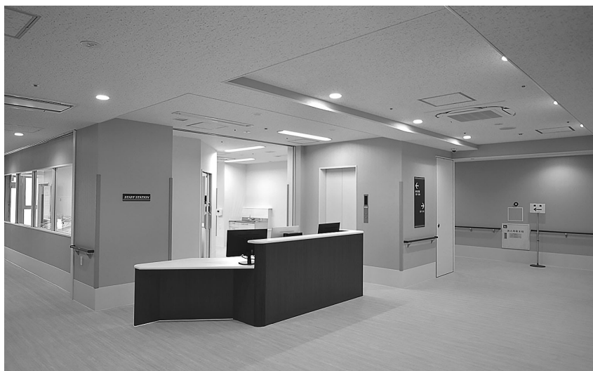
3F スタッフステーション