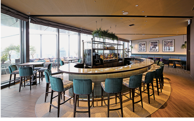
28階ラフトップバー&ラウンジ「PEAKS」