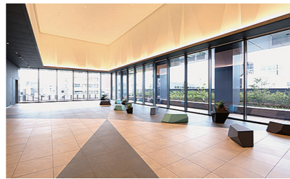
8階オフィスロビー