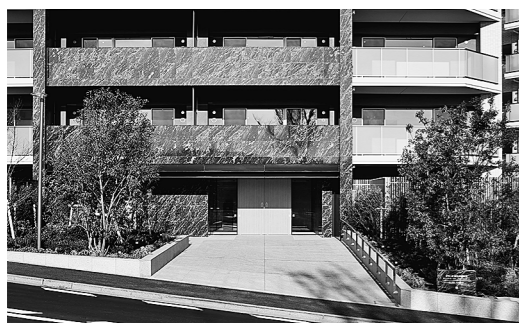
エントランス外観