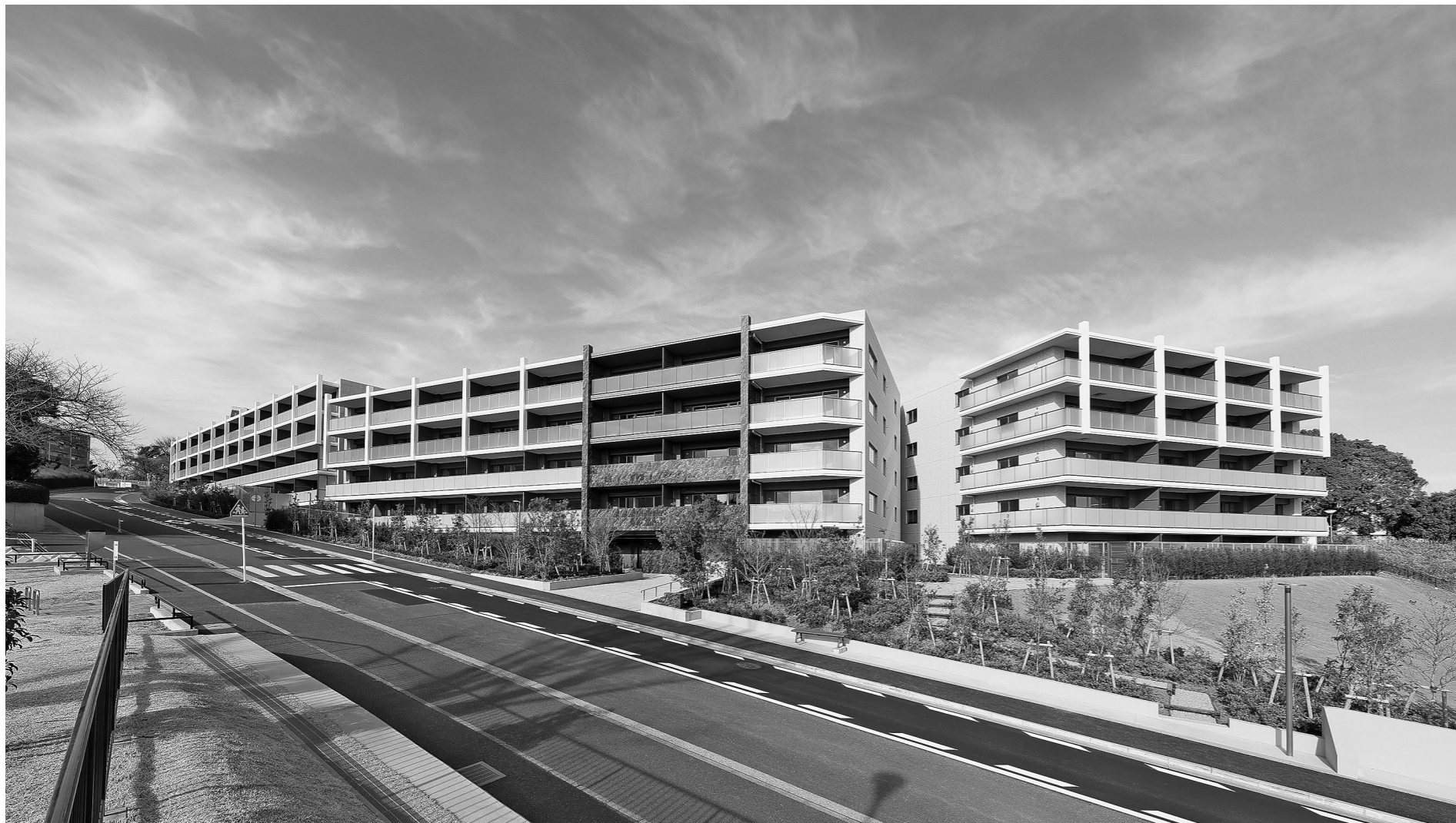
高低差のある敷地に3棟を建設

ゴールドクレストが横浜市磯子区に開発した新築分譲マンション「クレストレジデンス横浜汐見台パークフロント」が完成した。建物正面に公園が広がる立地に、ファミリー層がゆとりを持って暮らせる住空間を確保している。施設の設計は、意匠設備をエフアイ都市設計(東京都文京区)、構造をクロスファクトリー(千葉県船橋市)が担当。新日本建設が施工した。