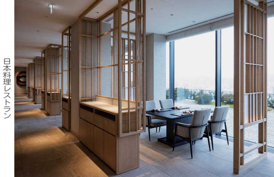
日本料理レストラン