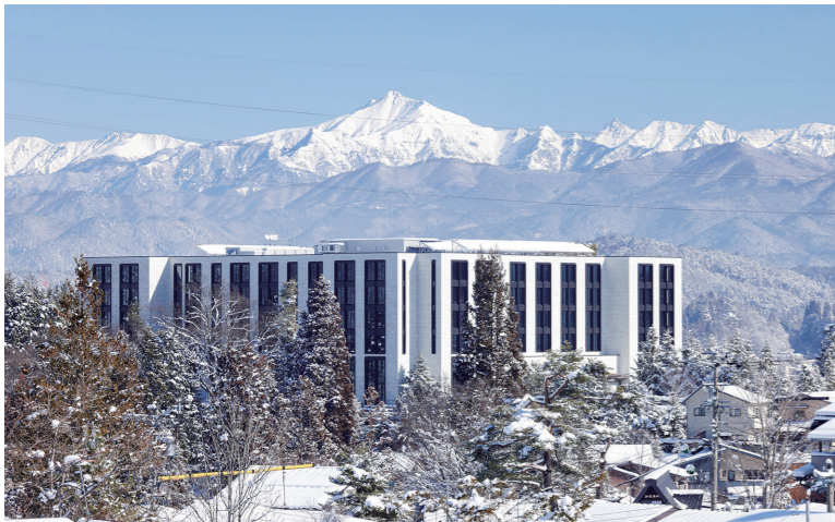
東方の北アルプス・穂高岳を望む