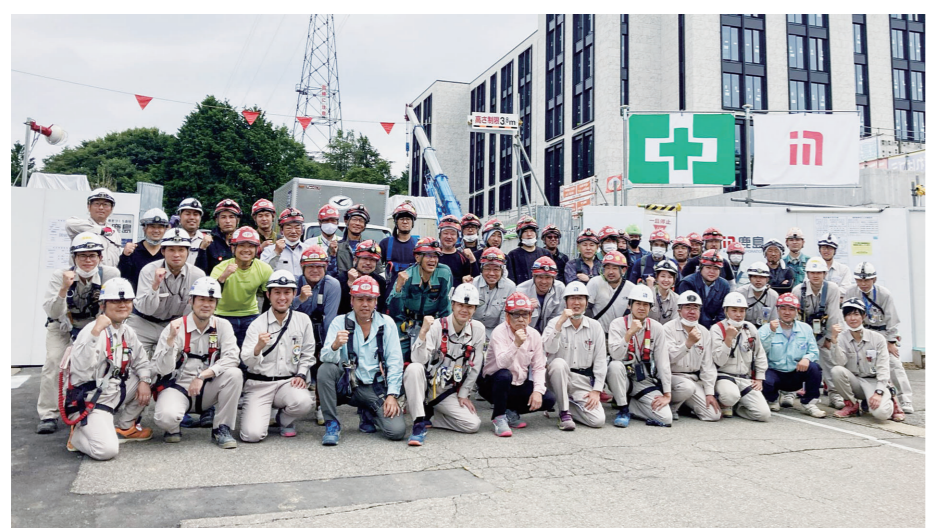
所員と職長でそろって撮影