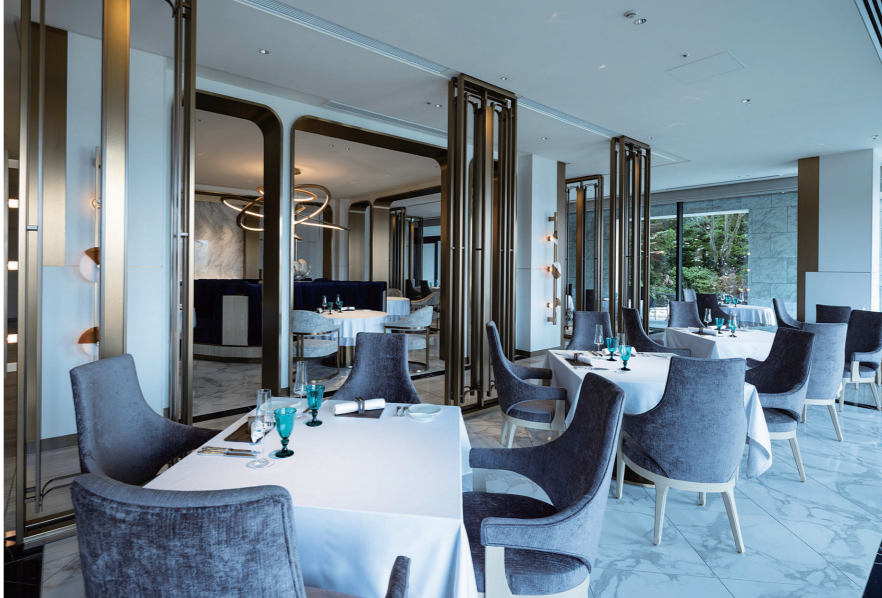
イタリア料理レストラン