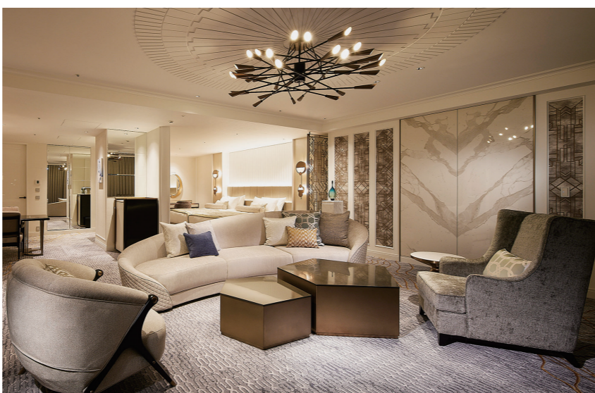
ロイヤルスイート・洋ルーム