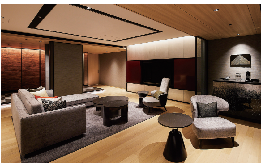
ロイヤルスイート・和モダンルーム