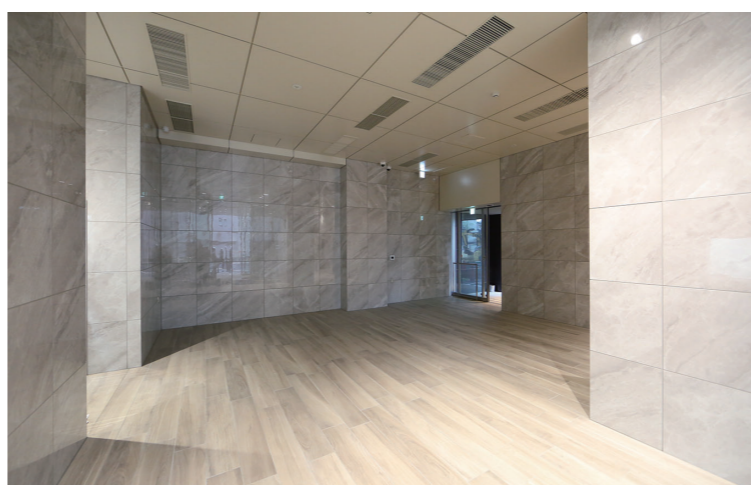
エントランスホール