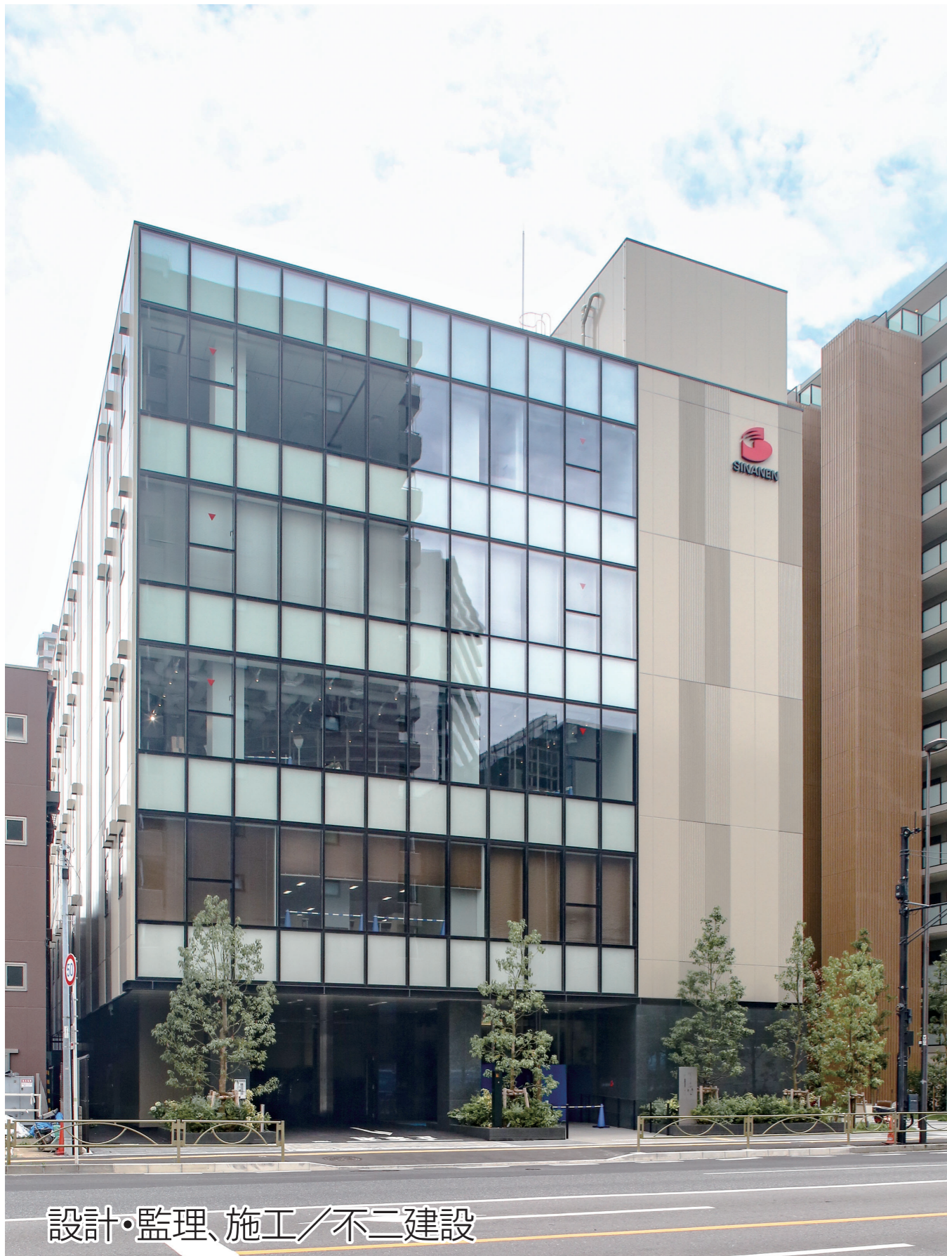
設計・監理、施工/不二建設

シナネンホールディングスグループが東京都品川区で建設していた新本社ビル「品川天王洲ビル」が完成した。同グループが持つ敷地を阪急阪神不動産が取得し、新本社ビルの建設資金と土地代金を相殺する「等