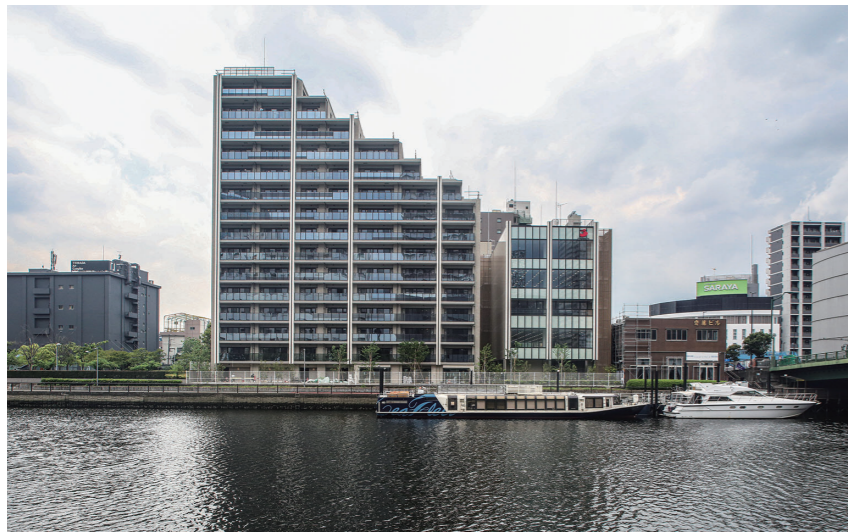
運河側から見た全景