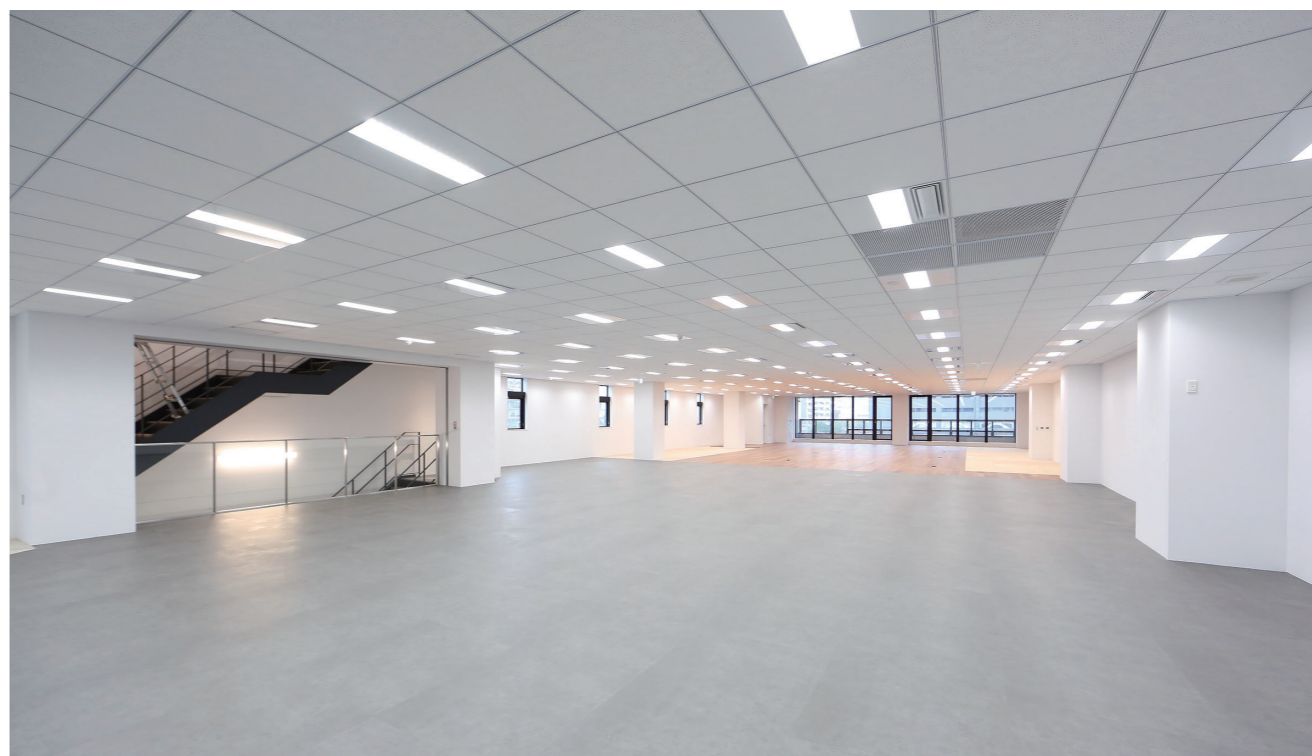
大空間の事務所スペース

ある「品川燃料」を略して名付けられました。私たちのルーツである地に、新本社を構えることを原点回帰とし、新たな飛躍への転機と捉えております。これまで、当社グループは時代の変化に合わせて、さまざまなサービスを提供しながら歴史を紡ぎ、2027年に創業100周年を迎えることとなります。さまざまな社会環境の変化が起る時代となりましたが、当社グループはこの場所から、「エネルギーの炎」を「サービスの炎」に変えて灯し続け、地域すべてのお客さまの快適な生活に貢献する企業グループとして成長を続けてまいります。