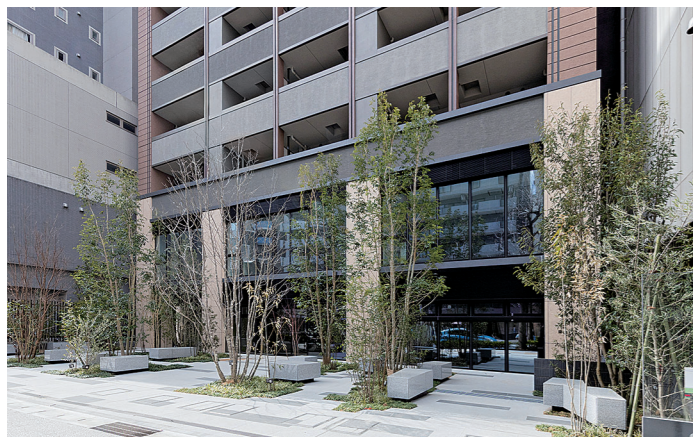
緑豊かな公開空地