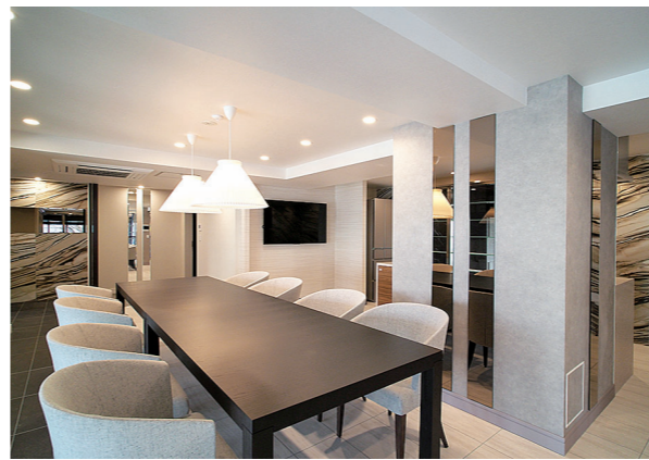
パーティールーム