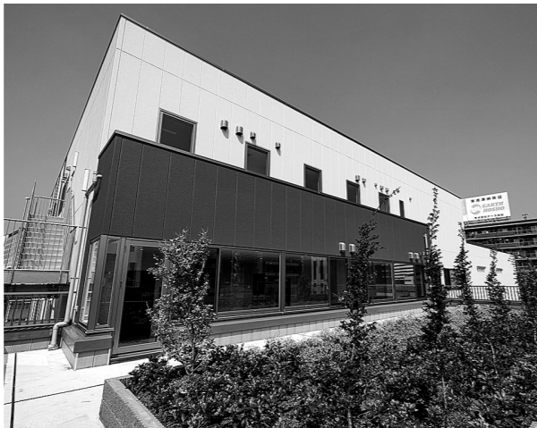
緑化したルーフトラス