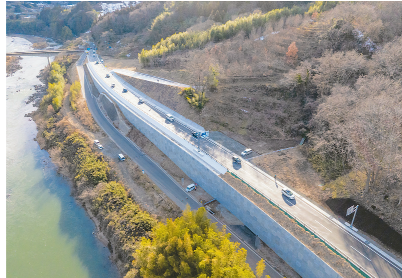
県境付近(丸森町→伊達市)