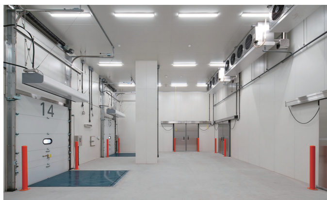
ドックシェルター付保冷庫