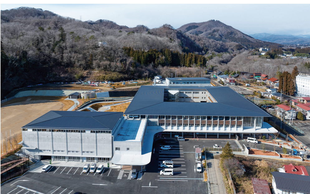
施設全景