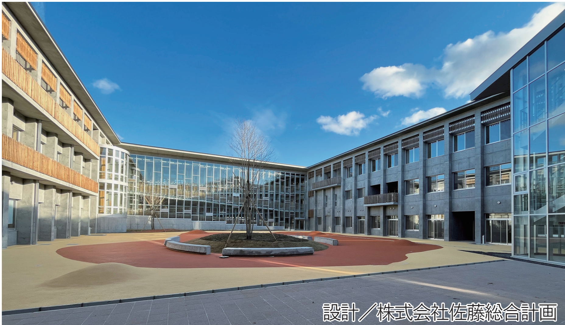
設計/株式会社佐藤総合計画