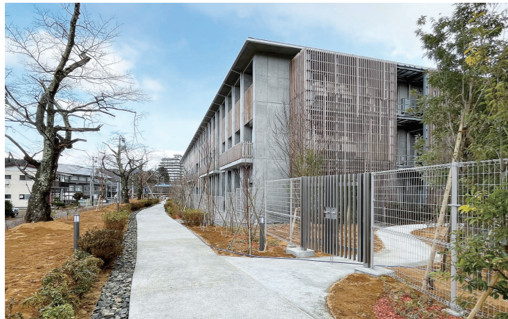
地域とつなぐ「さくらの小径」

【校章デザイン・スクールカラー】 校章の中央部に「秋保」のAを星形で囲み、一人一人が伸び伸びと学び、輝き重ね合わせることで、地域や家族、教職員らの関わりを表現した。スクールカラーは自然豊かな環境をイメージする青竹色。「かがやきグリーン」と名付けた。