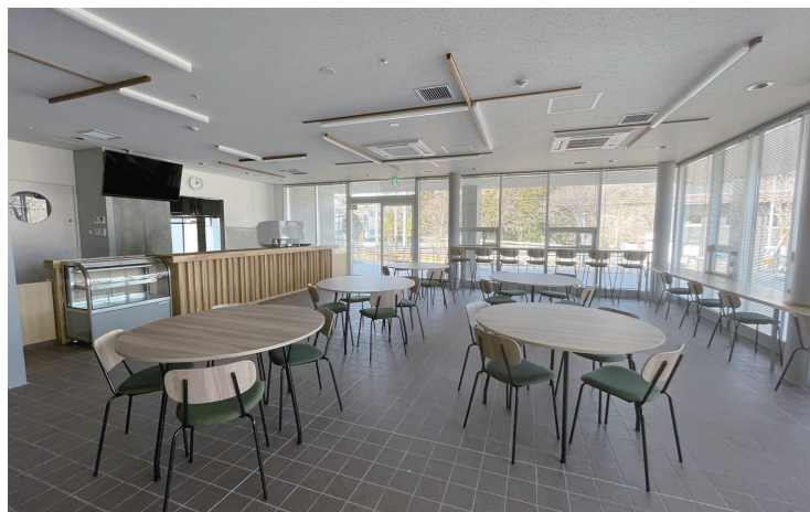
交流拠点「どまカフェ」

工事概要 ■工事名称: 仙台南部地区特別支援学校新築事業 ■工事場所: 仙台市太白区秋保町湯元字鹿乙20地 ■発注者: 宮城県 ■敷地面積: 2万6,042㎡ ■建築面積: 6,896㎡ ■延床面積: 1万5,596㎡ ■構造階数: RC造一部SRC造、S造、W造4階 ■設計: 株式会社佐藤総合計画 ■施工: 建築—前田建設工業・西武建設・阿部和工務店J V 電気—電気工事平間組 電気—新築電設工業 空調—アトマックス 衛生—生ダイマル 昇降機—フジテック ■工期: 2022年3月~2023年12月