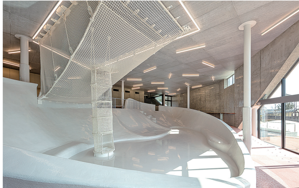
児童屋内遊戯施設「てみわのわらわ」