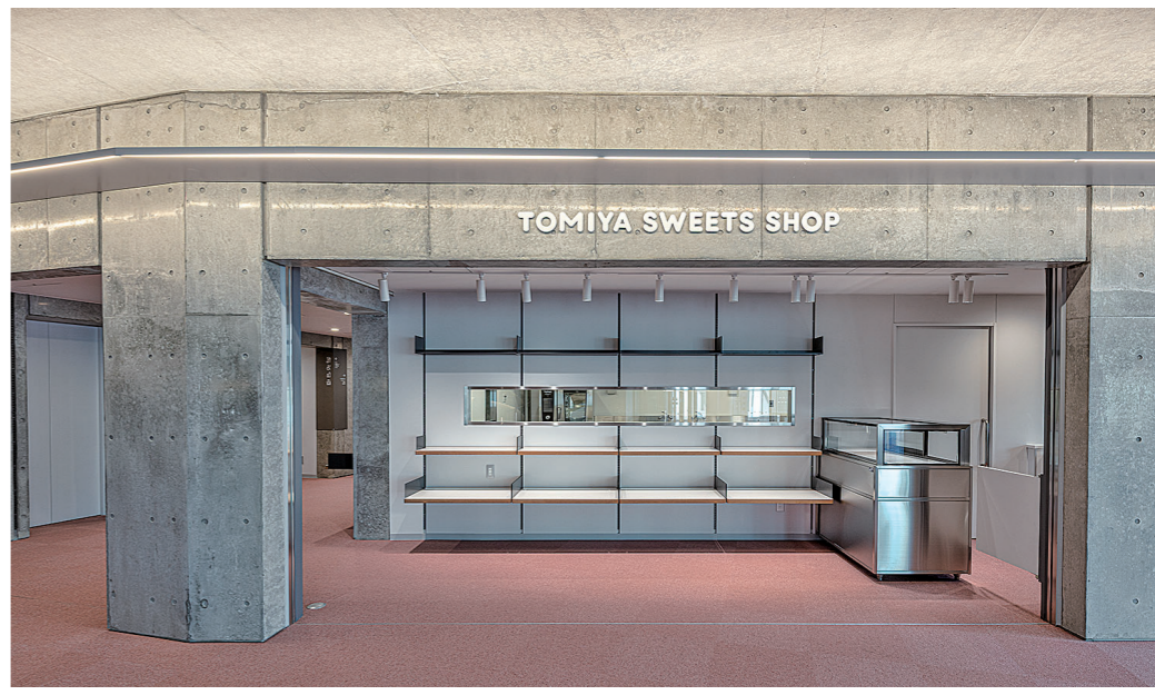
スイーツステーション