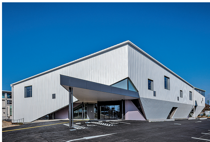
正面から見た外観