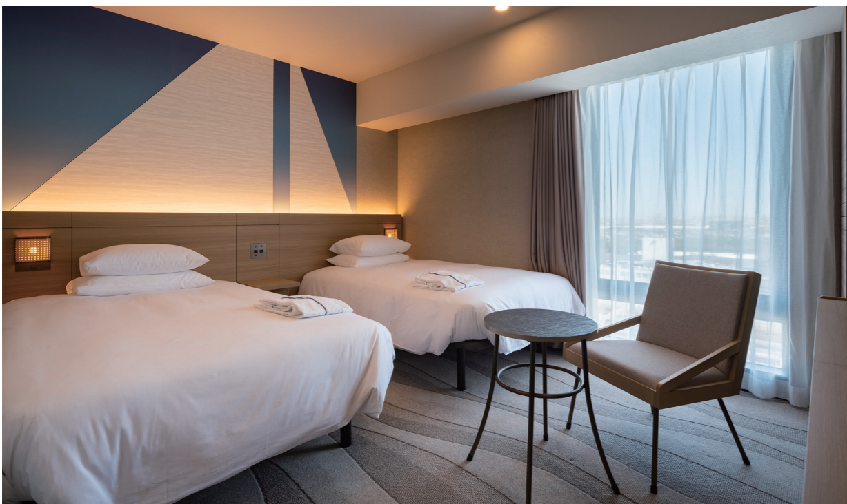
客室(スーパリアーキング)