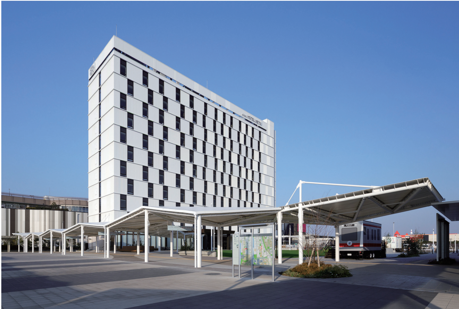
設計/JR東日本建築設計 施工/東鉄工業

験ハウスを配置。宿泊客だけでなく、沿線住民にも楽しんでほしい、幕張新都心エリアのさらなる活性化に貢献していく。建物の設計はJR東日本建築設計、施工は東鉄工業が担当した。