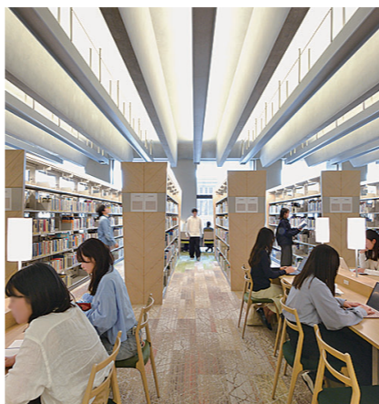
開放的な図書館閲覧室