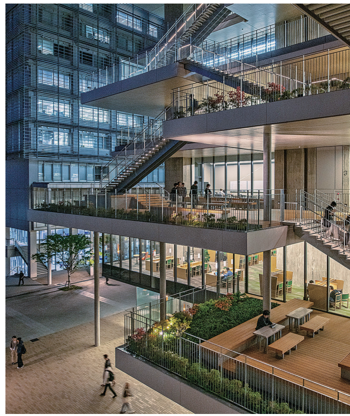
学生たちの動線となるバルコニーと屋外階段

「センターcommons」の広いバルコニーや屋外階段は、ここから学生の活動がさまざまな居場所や広場へあふれ出し、キャンパス全体に知の交流が広がることを意図しています。