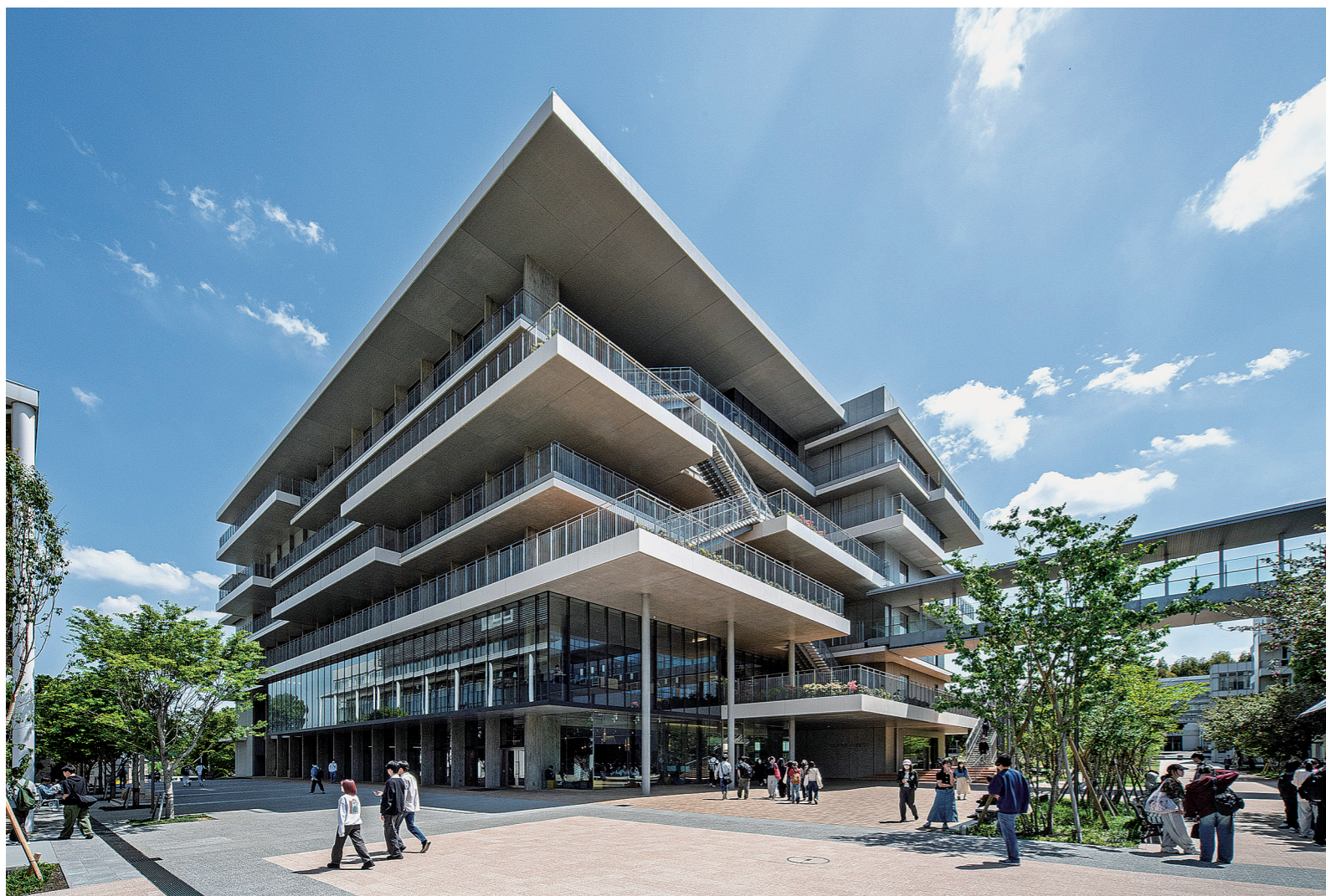
設計・監理/日建設計 施工/フジタ