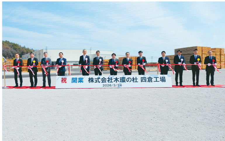
代表者らによるテープカット

3月24日 開業式 操業開始に合わせ、来「福島県内の森林保全」が、関係者から約100人が参加し、3月24日、工場建設プロジェクトに開業式が開かれ、代表者が参加できたことは意義深い。順調な操業を継続していただくため、アフターフォローにも全力で取組んでいく」と力強く決意を語った。