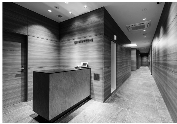
1階エントランスホール