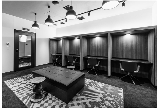
6階オープンラウンジ