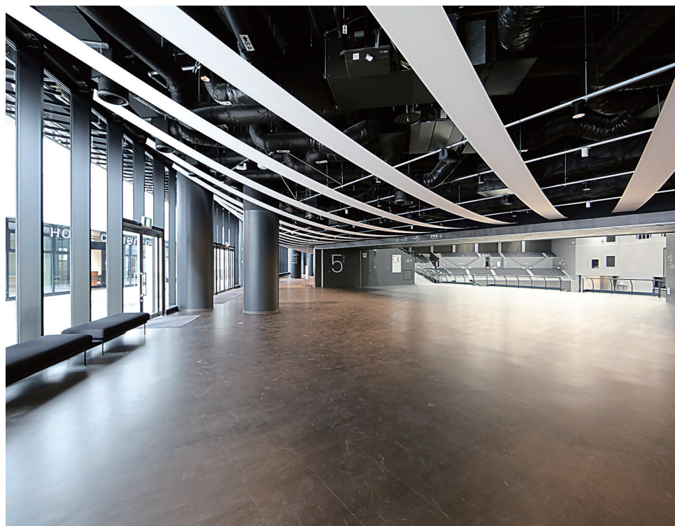
メインエントランス