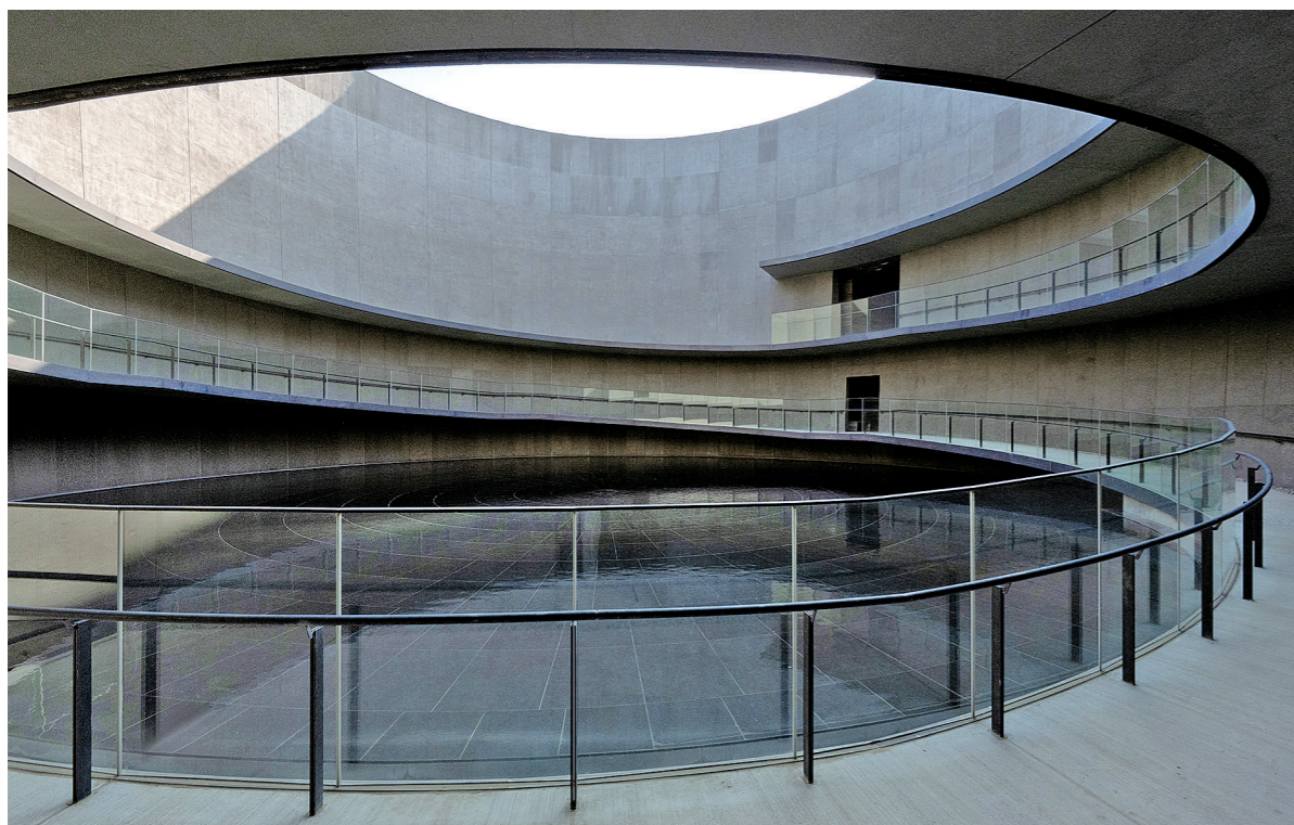
円筒形の空間/水盤

震災の教訓 伝え、つなぐ 復興に関するイベントをはじめ、様々な活動ができる約3・0分の芝生広場が広がります。災害時の臨時ヘリポートの機能も備えています。 地震や津波による被災の後、原子力発電所事故の影響により長期避難を余儀なくされた集落の面影が遺されています。 オアシスマツクラをはじめとした桜の木が地域の復興を見守る丘に植栽されています。 その特徴的な見た目から、地域の方言に「だんご山」と呼ばれていました。山の周辺では震災以前にあった水田の風景が広がっています。そのうち、福島県が整備した5つのエリアを紹介いたします。 復興に関するイベントをはじめ、様々な活動ができる約3・0分の芝生広場が広がります。災害時の臨時ヘリポートの機能も備えています。 地震や津波による被災の後、原子力発電所事故の影響により長期避難を余儀なくされた集落の面影が遺されています。 オアシスマツクラをはじめとした桜の木が地域の復興を見守る丘に植栽されています。