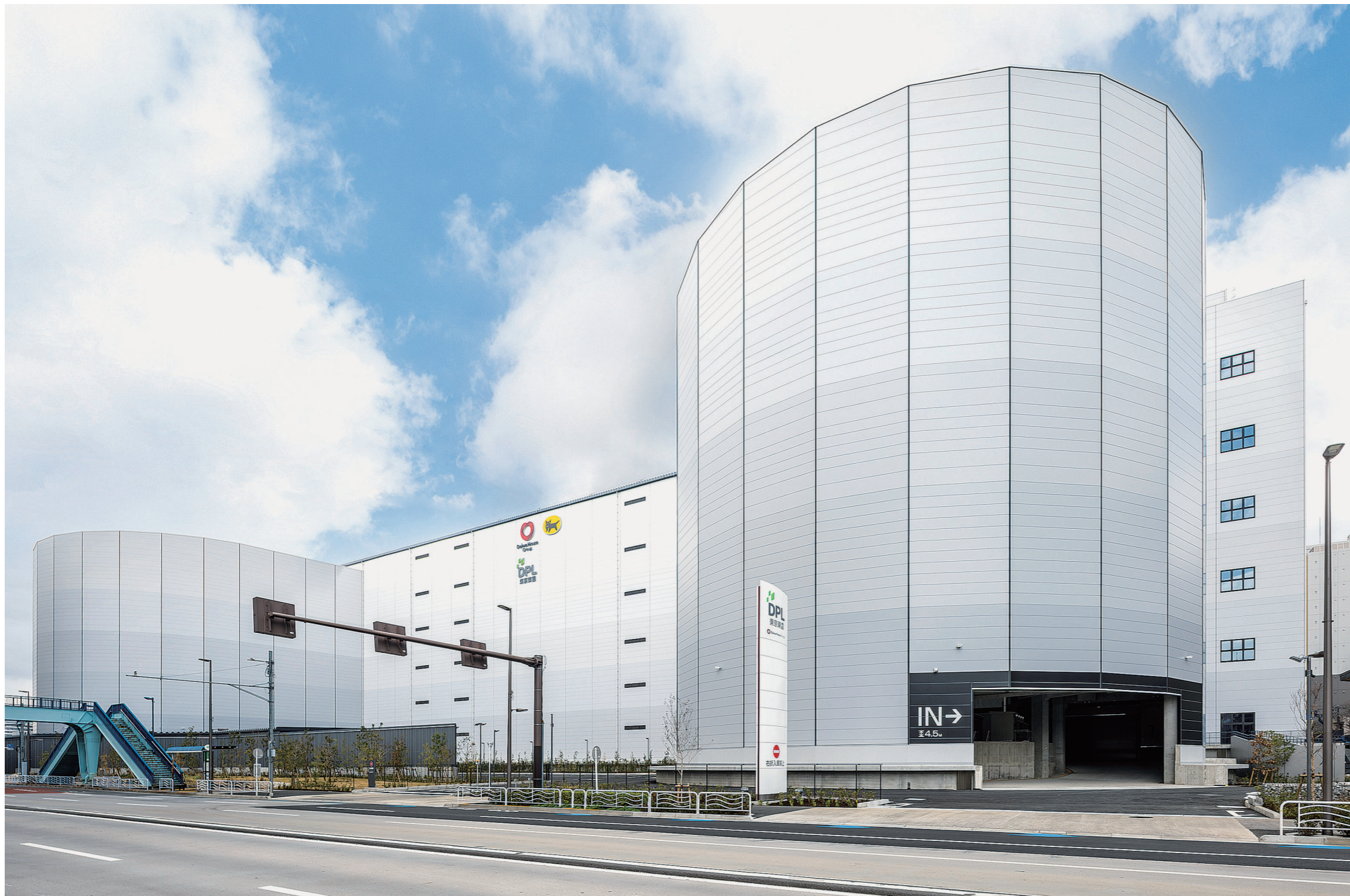
設計/フクダ・アンド・パートナーズ 施工/西松建設