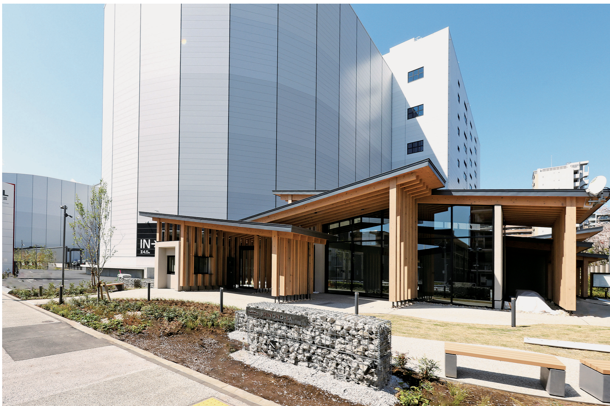
地域貢献施設「SHINONO-BA」

大和ハウス工業が東京都江東区で整備を進めてきた延べ15万㎡超の大型マルチテナント型物流施設「DPL東京東雲」が完成した。都内で同社が開発した最大の都市型物流施設となり、陸海空の物流インフラへのアクセスに優れた場所に立つ。働きやすさや、地域との共生も意識した施設づくりを行った。設計監理はフクダ・アンド・パートナーズ(東京都中央区、福田哲也代表取締役)、施工は西松建設が担当した。