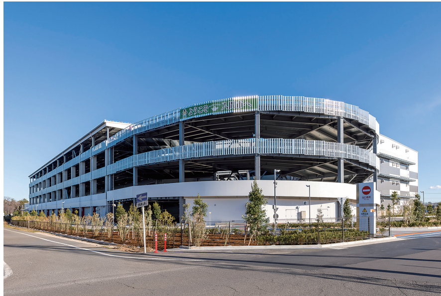
ランプウェイ側から見た外観

また、環境配慮の面では、LED照明、節水型衛生器具、太陽光パネルを採用し、省エネルギー化および環境負荷低減を実現しています。これらの取り組みにより、CASBEE埼玉「Aランク」、BELS認証(ZEB)、DBJグリーンビルディング認証を取得しています。さらに、入間市との防災協定に基づき、施設内に防災パークを整備するとともに、入間市をPRするサインを設置するなど、行政との連携を重視した計画としています。