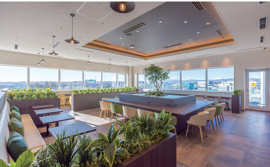
最上階の富士山ラウンジ