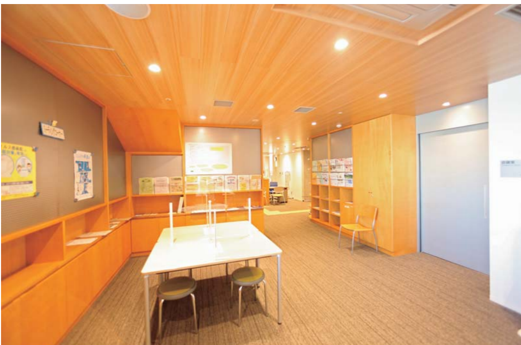
区民活動支援センター

工事概要 ■ 工事名称 港南公会堂及び港南土木事務所整備工事 ■ 所在地 横浜市港南区港南中央通978番地の1 ■ 設計・監理 株式会社新居千秋都市建築設計 ■ 施工 松尾・大洋・安藤建設共同企業体 ■ 敷地面積 3,007.95㎡ ■ 建築面積 1,920.69㎡ ■ 延床面積 5,940.57㎡ ■ 構造 規模 R C造一部 S 造・SRC造地下1階地上4階建て ■ 工期 2018年10月4日～2021年3月26日