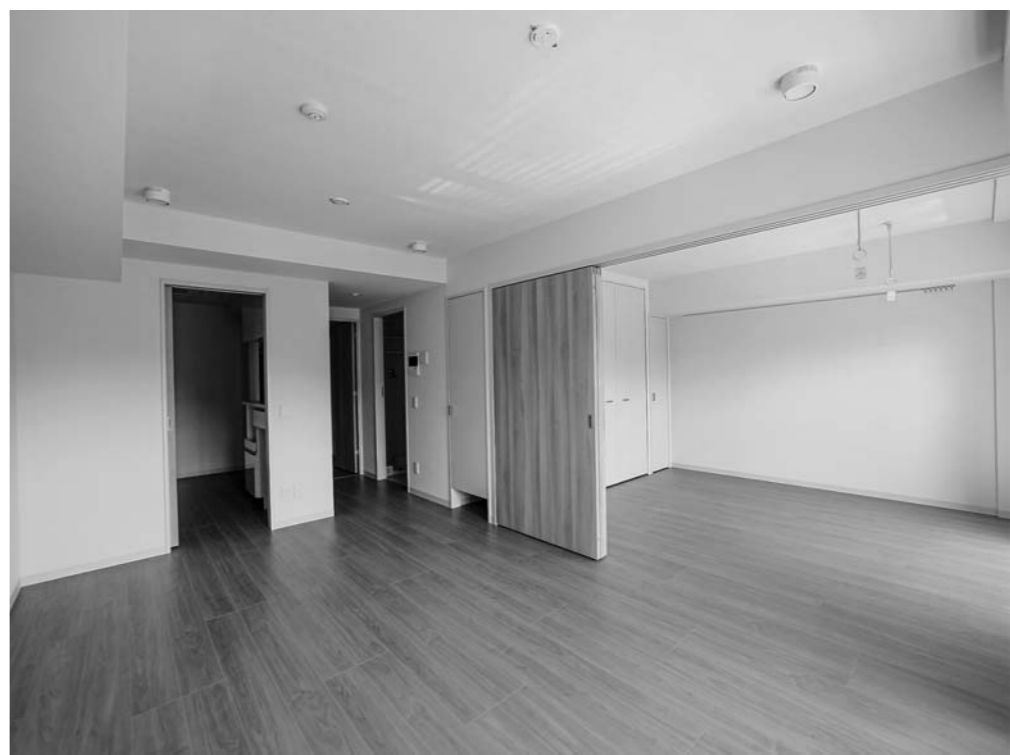
可動扉でフレキシブルな住まいが可能