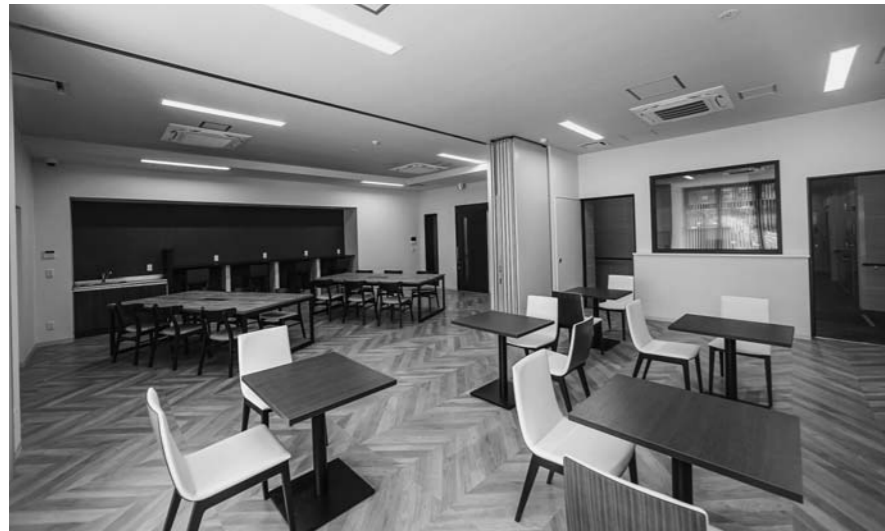
テレワークにも対応したシェアラウンジ