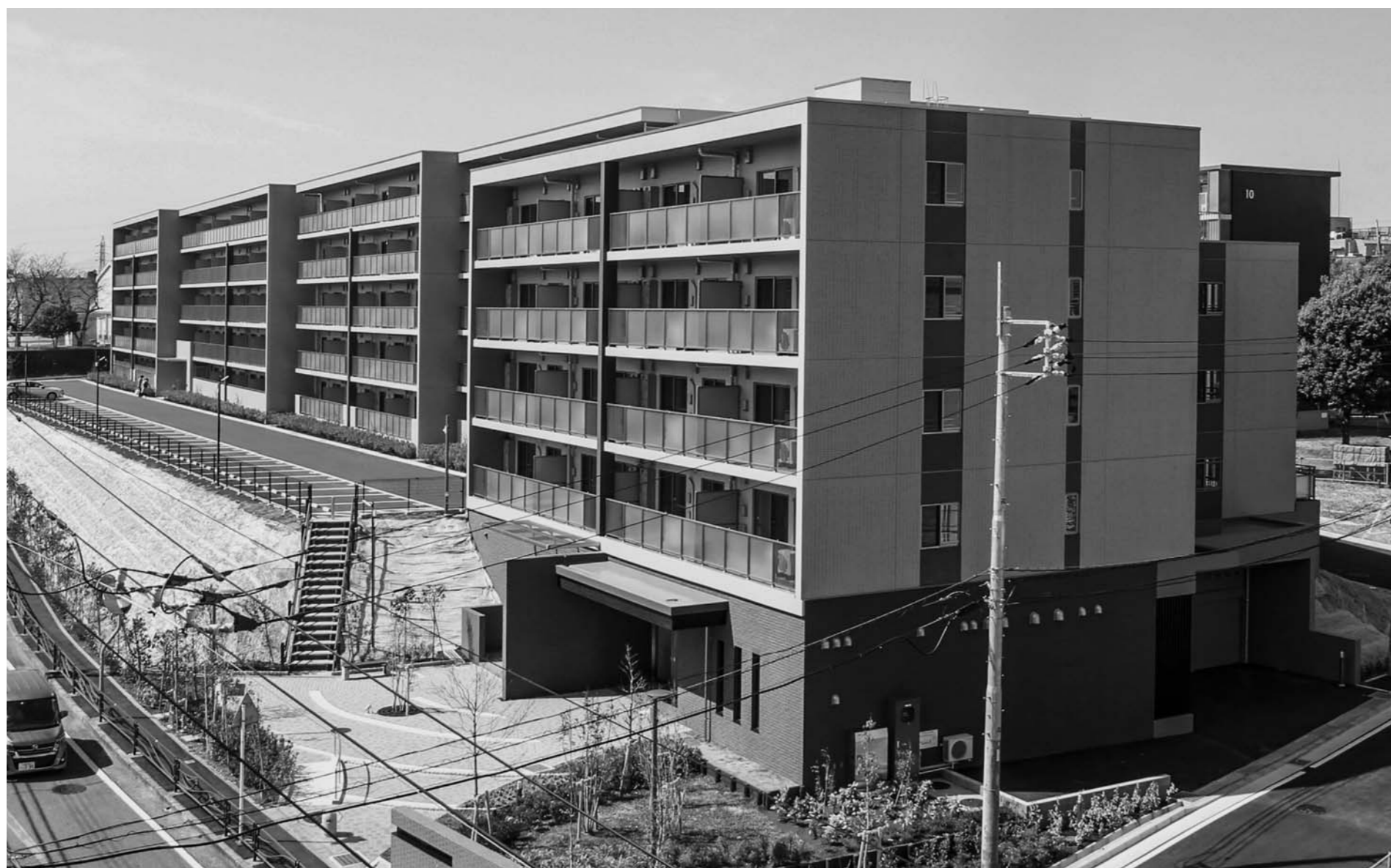
設計・監理・施工/大成ユーレック

神奈川県住宅供給公社が川崎市高津区で建設していた「フロール梶が谷」が完成した。同マンションは東急田園都市線・梶が谷駅から徒歩12分に立地。1LDKと2LDKを中心に106戸を備える。家事・収納アドバイザーの監修の収納スペースや多機能トイレといった多機能のほかに、新しいライフスタイルに合わせたアイデアを随所に採り入れている。設計・施工は大成ユーレックが担当した。