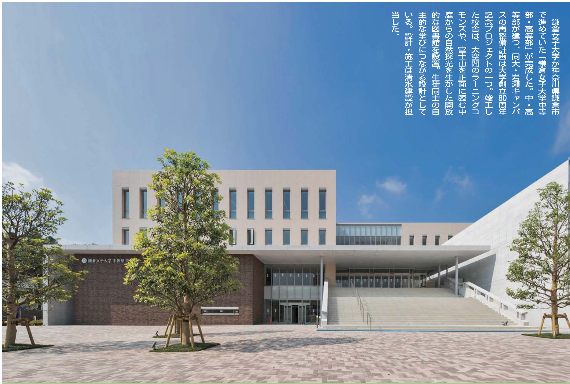
設計・施工/清水建設

鎌倉女子大学が神奈川県鎌倉市で進めていた「鎌倉女子大学中等部・高等部」が完成した。中等部・高等部が建つ、同大・岩瀬キャンパスの再整備計画は大学創立80周年記念プロジェクトの一つ。竣工した校舎は、大空間のラーニングcommonsや、富士山を正面に臨む中庭からの自然採光を生かした開放的な図書館を設け、生徒同士の自主的な学びにつながる設計としている。設計・施工は清水建設が担当した。