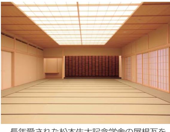
長年愛された松本生太記念学舎の屋根瓦をオブジェとして配置した礼法室