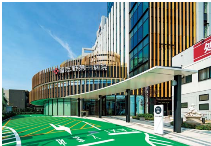
8号棟エントランス

社会医療法人社団菊田会が千葉県習志野市の習志野第一病院敷地内で進めていた8号棟増築工事が完了した。開放感あふれる待合室を整備したほか、診察室を増設した。昨年の7号棟も含め地域の救急医療拠点としての役割を果たす。設計・施工は大成建設が担当した。