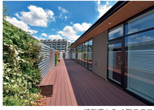
植栽豊かな4階テラス