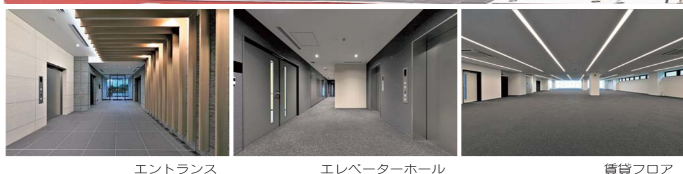
エントランス エレベーターホール 賃貸フロア