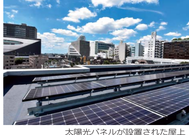
太陽光パネルが設置された屋上