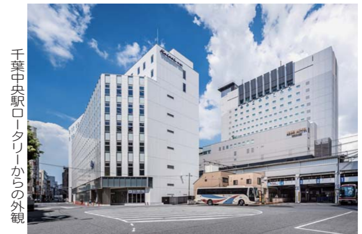
千葉中央駅西口からの外観