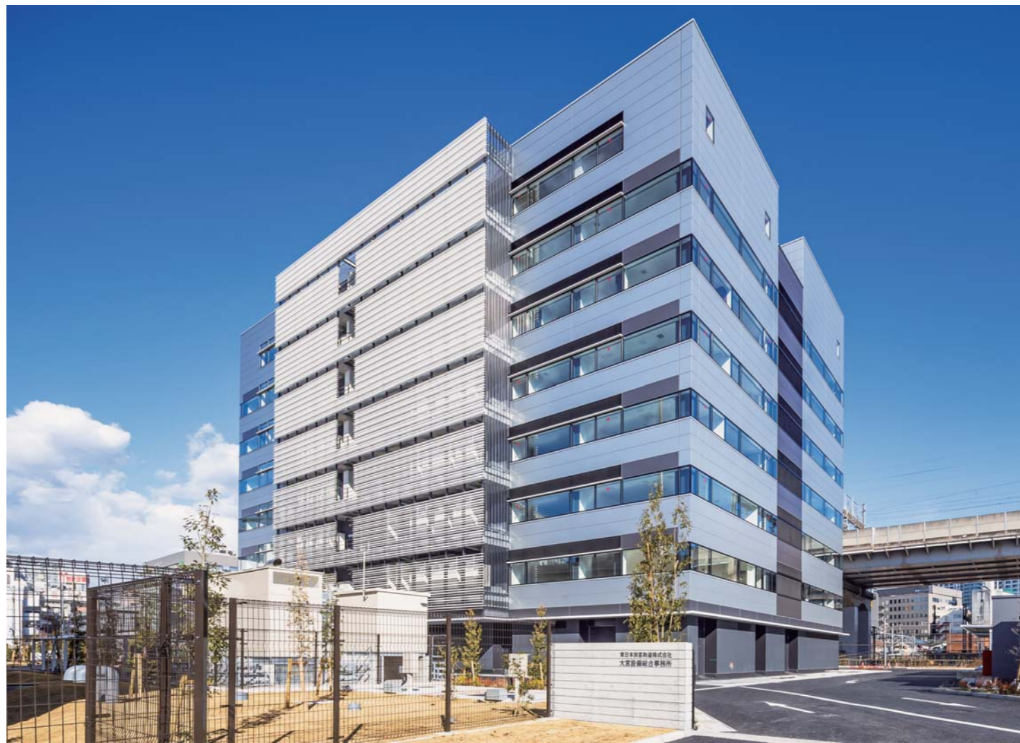
設備総務センター

計画地は明治期より鉄道事業を支えてきた歴史的な背景のある土地であり、現在は、全国有数の巨大ターミナル駅である大宮駅に近接した土地となります。そのよき土地の特性から、快適な執務環境と歴史の継承の両立を目指したデザインとしました。 新幹線車両の洗練されたフォルムや線路の持つ流線的な「連続性」と「軽快さ」を意識し、スマートで先進的な外観を計画し、妻側中央部・1階部分を分離したボリューム構成とすることで、街に対する圧迫感の軽減を図ると共に、街に対する圧迫感を軽減させたいと、前述のデザインを強調させています。 新しい働き方に対応した、E.Vホール・ラウンジスペース・執務スペースのつながりは見通しが良く、自然光を取り入れた気持ちの良い空間構成としました。また、その構成をベースに、繊細さと重厚