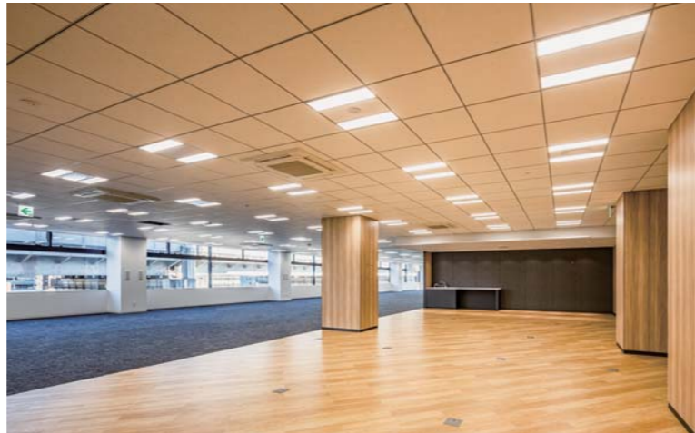
ラウンジスペース