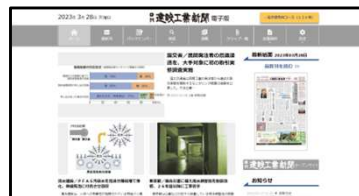
「日刊建設工業新聞 電子版」トップページ

会員登録制。いつでもどこでも日刊建設工業新聞を読むことができます。紙面・記事ビューアーや紙面PDFデータのダウンロードをはじめ、充実したサービスを提供しています。