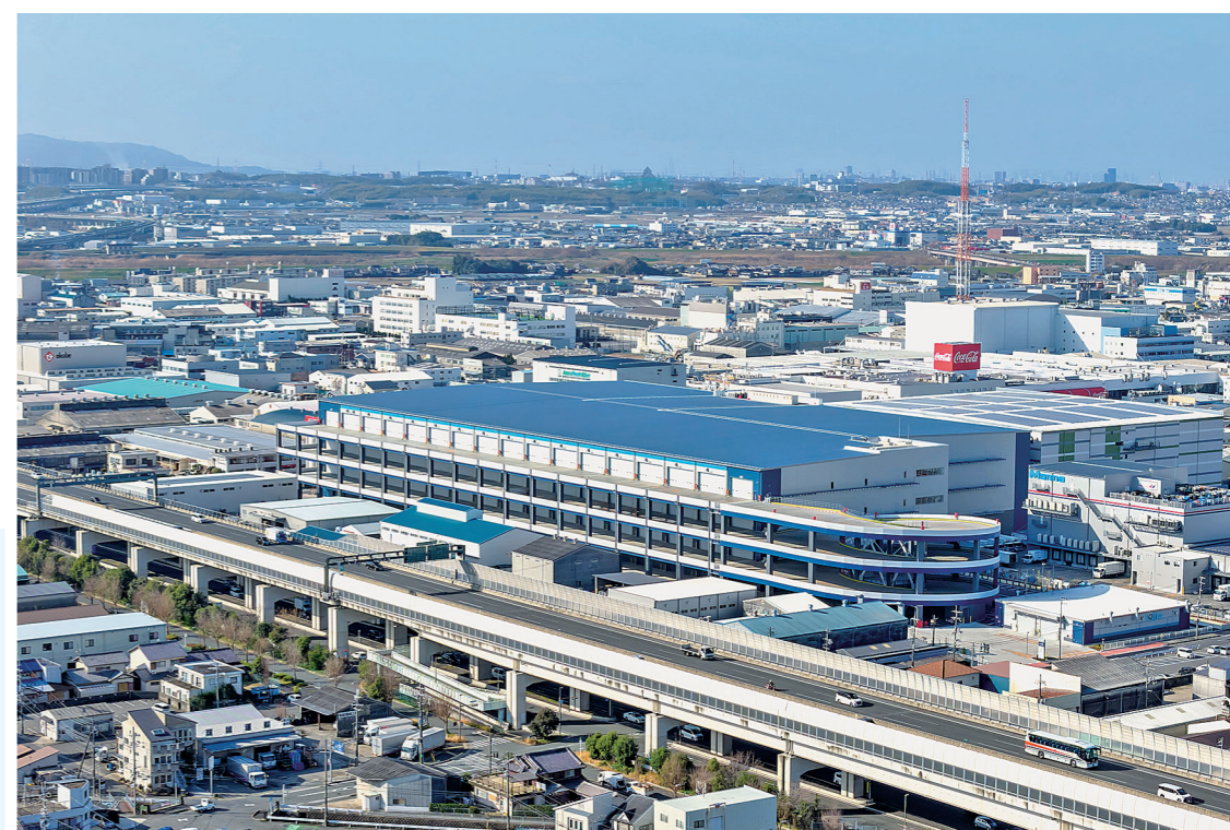
高速道路へのアクセスに優れた立地(北東面鳥瞰)