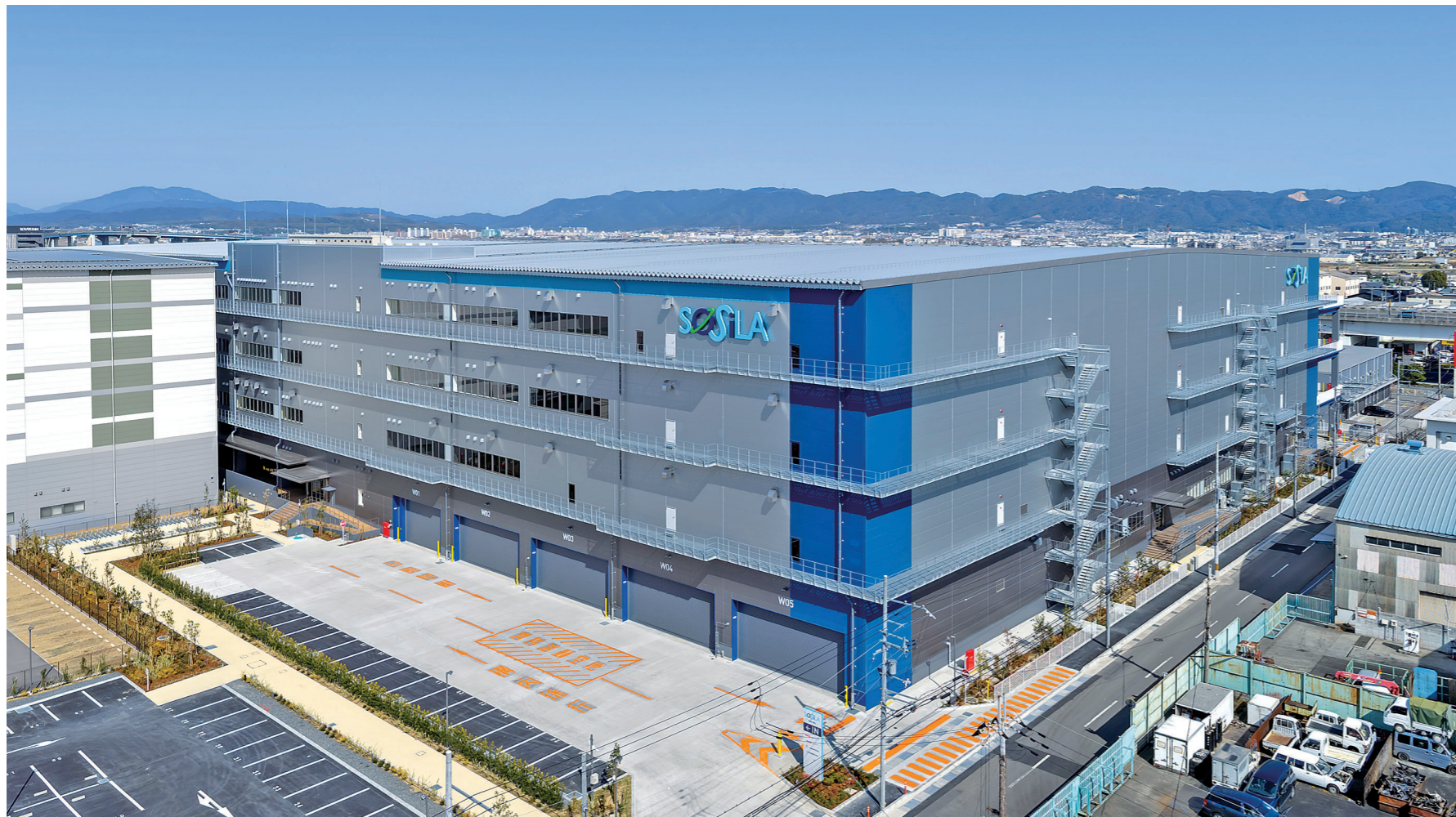
設計/浅井謙建築研究所 施工/前田建設